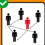
Zur Rückverfolgung immer vollständige Kontaktdaten angeben.