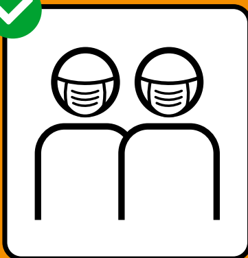
Maske tragen, wenn Abstandhalten nicht möglich ist.