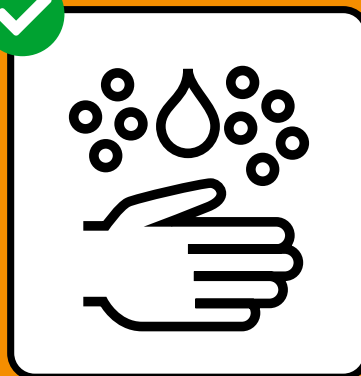
Gründlich Hände waschen.