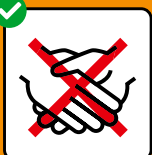
Hände schütteln vermeiden.