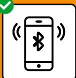
Um Infektionsketten zu stoppen: SwissCovid App downloaden und aktivieren.