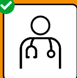
Bei Symptomen sofort testen lassen und zuhause bleiben.