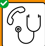
Nur nach telefonischer Anmeldung in Arztpraxis oder Notfallstation.