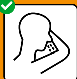
In Taschentuch oder Armbeuge husten und niesen.