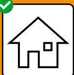
Bei positivem Test: Isolation. Bei Kontakt mit positiv getesteter Person: Quarantäne.